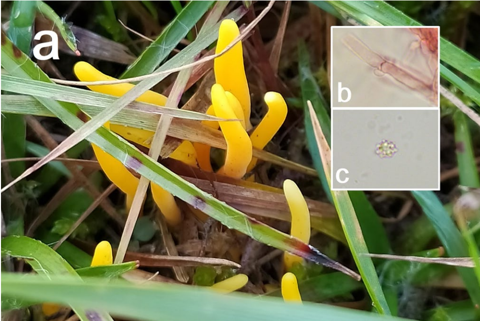
Fot. 8. Goździeniowiec miodowy Clavulinopsis helvola [WA0000168140]: a) owocniki, 15.10.2024, b) sprzążka, c) zarodnik, 20.11.2024.