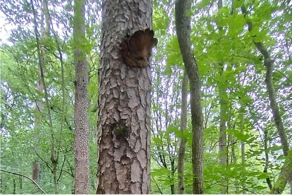
Fot. 28. Owocnik czyrogmatwicy sosnowej Porodaedalea pini, 05.07.2024. Photo 28. Basidioma of Porodaedalea pini, 05.07.2024.