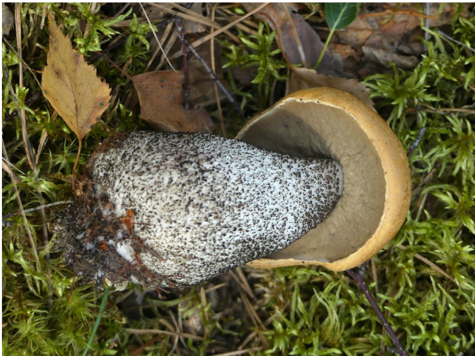
Fot. 21. Owocnik koźlarza pomarańczowożółtego Leccinum versipelle [WA0000167946], 30.08.2024.

Photo 21. Basidioma of Leccinum versipelle [WA0000167946], 30.08.2024.