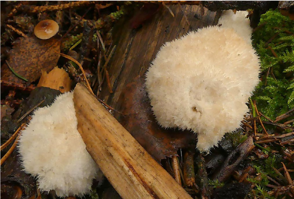
Fot. 29. Owocniki (anamorfy) Postia ptychogaster [WA0000167867], 13.11.2024. Photo 29. Basidiomata (anamorphs) of Postia ptychogaster [WA0000167867], 13.11.2024.