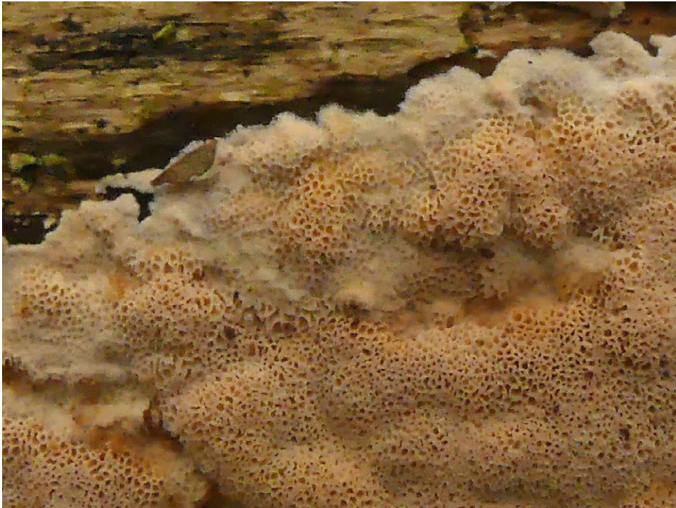
Fot. 17. Owocnik porokolczaka lśniącego Junghuhnia nitida [WA0000167825], 09.11.2024.

2. BD 03, Równina Nowotomska, woj. wielkopolskie, pow. nowotomyski, gm. Międzichowo, Bolewice, N 52.3818, E 16.1100,