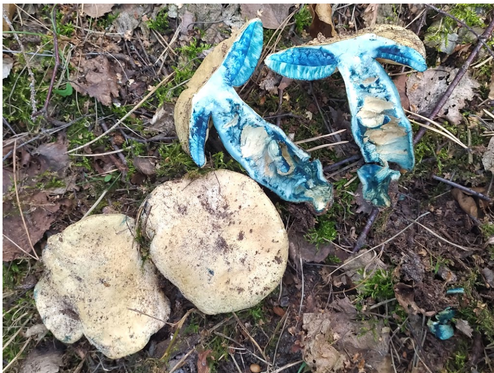
Fot. 13. Owocniki piaskowca modrzaka Gyroporus cyanescens [WA0000168047], 28.08.2024.