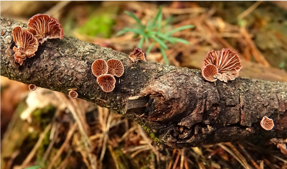
Fot. 24. Owocniki lycznika fioletowawego Panellus violaceofulvus, 30.12.2023.