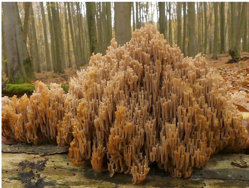
Fot. 4. Owocnik świecznika rozgałęzionego Artomyces pyxidatus [WA0000167775], 09.11.2024.

Photo 4. Basidioma of Artomyces pyxidatus [WA0000167775], 09.11.2024 (photo by G. Domian).