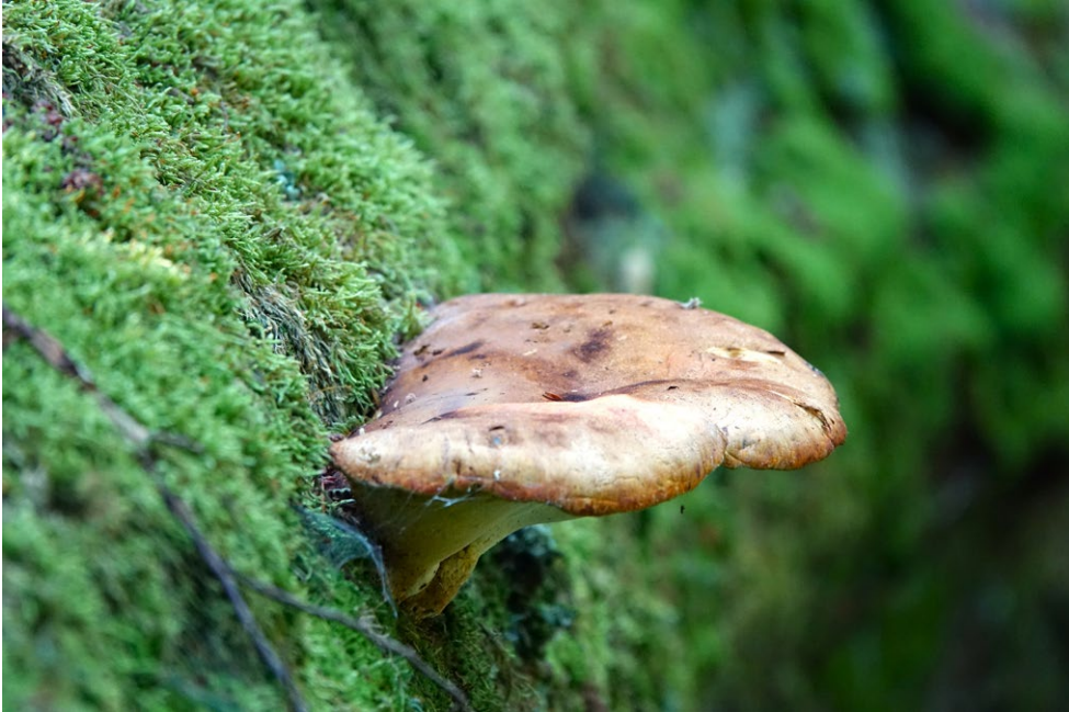
Fot. 11. Owocnik porojeżyka dębowego Buglossoporus quercinus = Fomitopsis pulvina, 30.07.2023.

Photo 11. Basidioma of Buglossoporus quercinus = Fomitopsis pulvina, 30.07.2023.