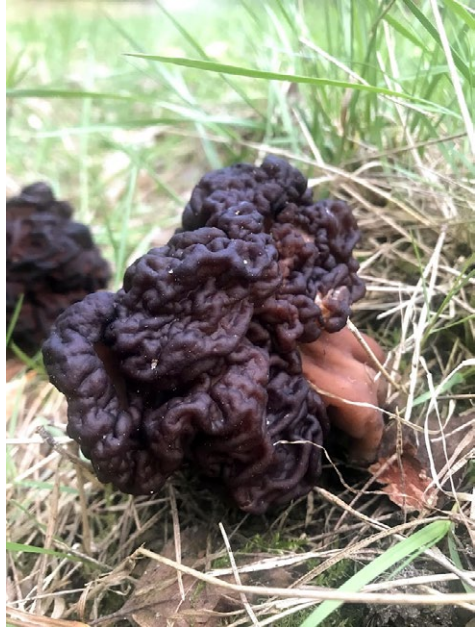
Fot. 1. Owocnik piestrzenicy kasztanowatej Gyromitra esculenta, 17.03.2024.

fotograficzną) MWi, ver. MS. (fot. 1). Uwagi : stanowisko w Drawieńskim PN, N2000 Uroczyska Puszczy Drawskiej, N2000 Lasy Puszczy nad Drawą.