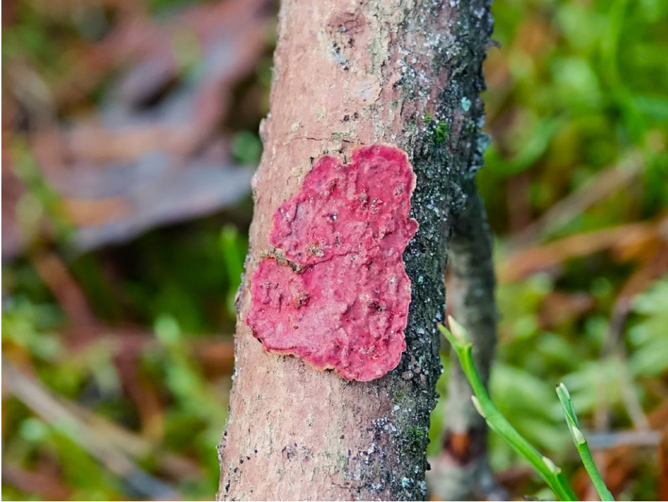
Fot. 15. Owocnik szczeciniaka jodłowego Hymenochaete cruenta, 29.12.2023. Photo 15. Basidioma of Hymenochaete cruenta, 29.12.2023.