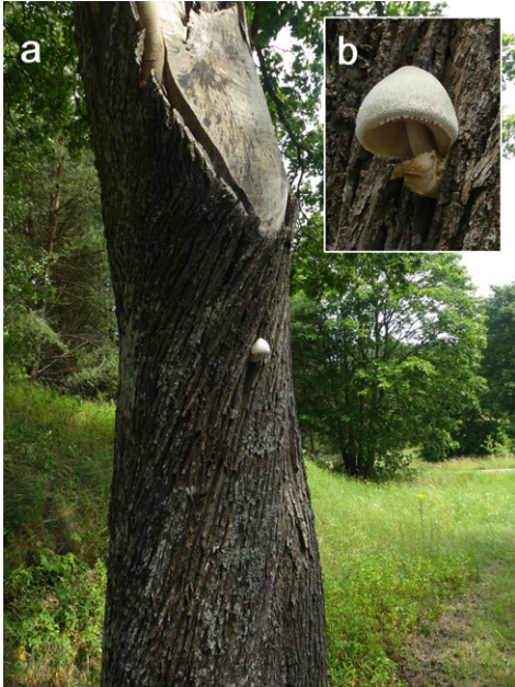
Fot. 32. Pochwiak jedwabnikowy Volvariella bombycina [WA0000167976]: a) pień drzewa z owocnikiem; b) zbliżenie na owocnik, 30.06.2024.

Photo 32. Volvariella bombycina [WA0000167976]: a) tree trunk with basidioma; b) close-up of basidioma, 30.06.2024.