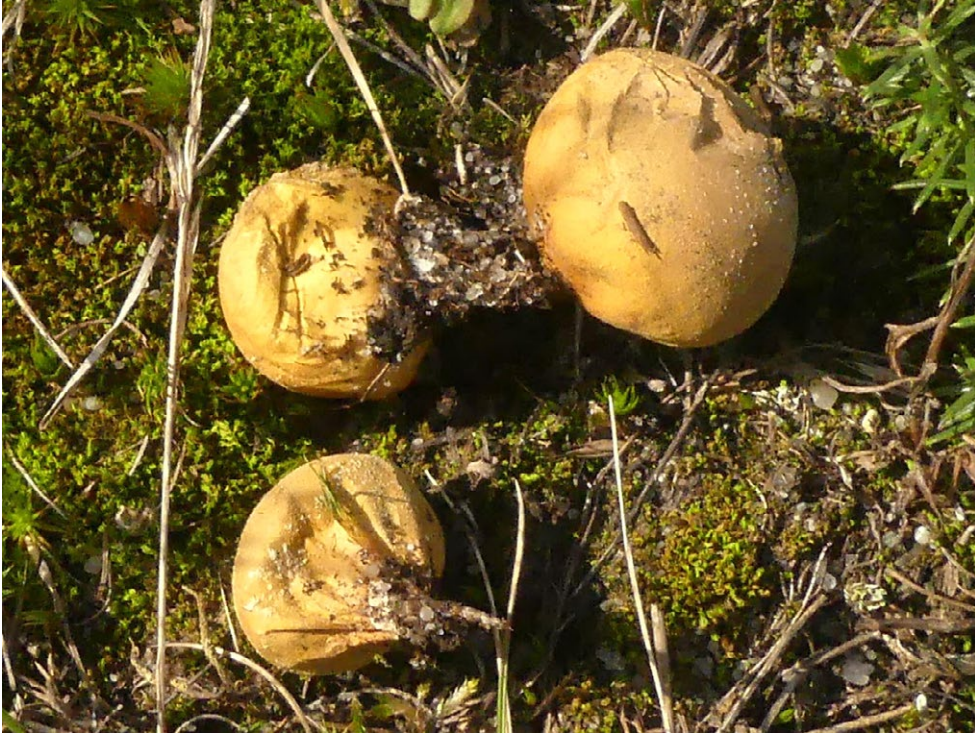
Fot. 7. Owocniki kurzawki drobnej Bovista pusilla [WA0000167782], 18.10.2024. Photo 7. Basidiomata of Bovista pusilla [WA0000167782], 18.10.2024.

Uwagi: stanowisko w Gryżyńskim PK, N2000 Rynna Gryżyny.