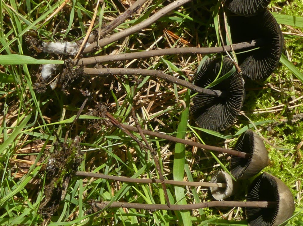
Fot. 23. Owocniki kołpaczka mierzwiowego Panaeolus papilionaceus [WA0000167960], 30.07.2024.