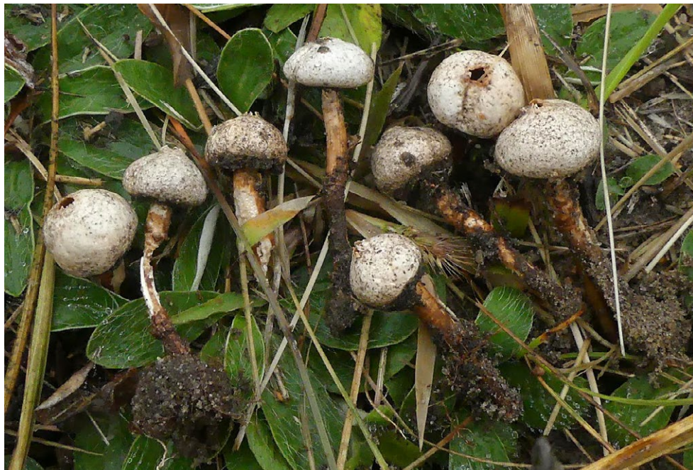
Fot. 30. Owocniki berłoweczki frędzelkowej Tulostoma fimbriatum [WA0000167900], 13.09.2024.

Photo 30. Basidiomata of Tulostoma fimbriatum [WA0000167900], 13.09.2024.