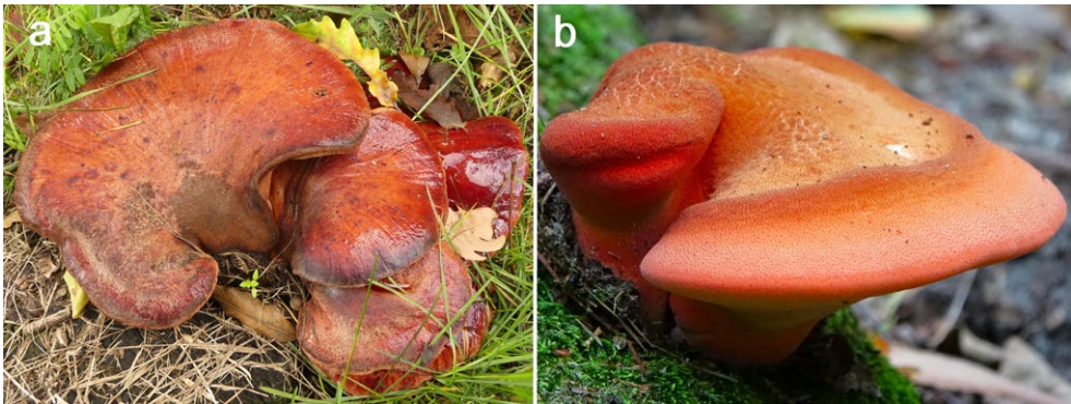
Fot. 10. Owocniki ozorka dębowego Fistulina hepatica : a) 11.10.2024, b) 30.07.2023.

Photo 9. Exobasidium vaccinii : a) [WA0000167896], 11.08.2024 (photo by G. Domian), b) [WA0000168005], 04.07.2024 (photo by B. Kudławiec), c) [WA0000168034], 25.08.2024 (photo by Katarzyna Włoch), d) [WA0000167927], 30.08.2024 (photo by M. Łożek).