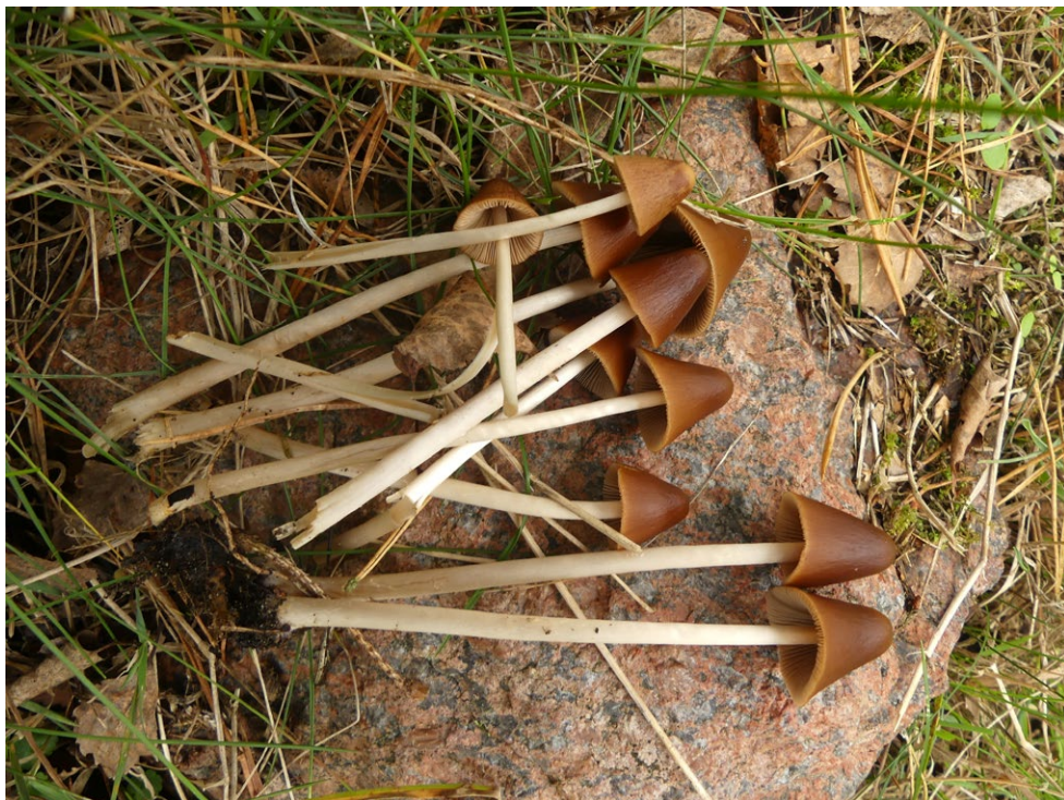
Fot. 25. Owocniki Parasola conopila [WA0000167965], 14.10.2024.

Uwagi: stanowisko w otulinie SzPK, N2000 Wzgórza Bukowe.