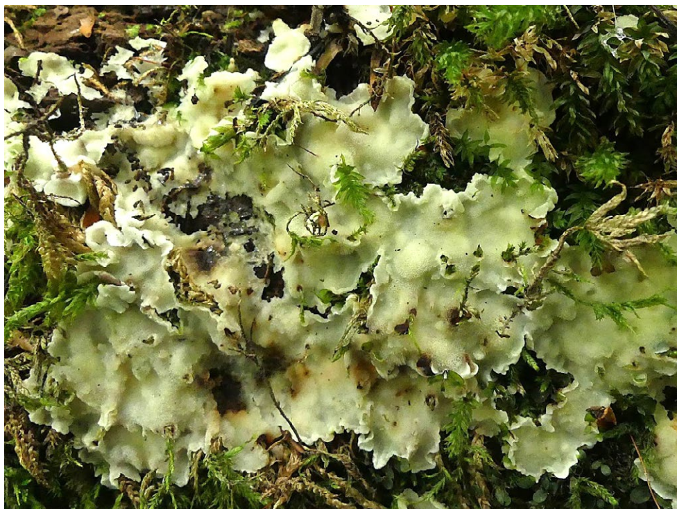
Fot. 26. Owocniki zmiennoporka szklistego Physisporinus vitreus [WA0000167859], 22.08.2024.