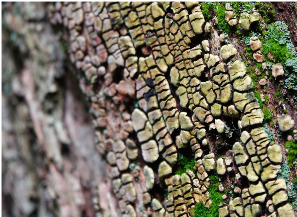
Fot. 33. Owocniki drewnowca popękanego Xylobolus frustulatus, 30.07.2023. Photo 33. Basidiomata of Xylobolus frustulatus 30.07.2023.

nowisko w Spalskim PK, RP Spała, N2000 Lasy Spalskie.