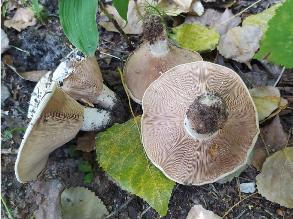
Fot. 19. Owocniki mleczająa różowoblaszkowego Lactarius controversus [WA0000168057], 28.08.2024.

Photo 19. Basidiomata of Lactarius controversus [WA0000168057], 28.08.2024 (photo by B. Kudławiec).