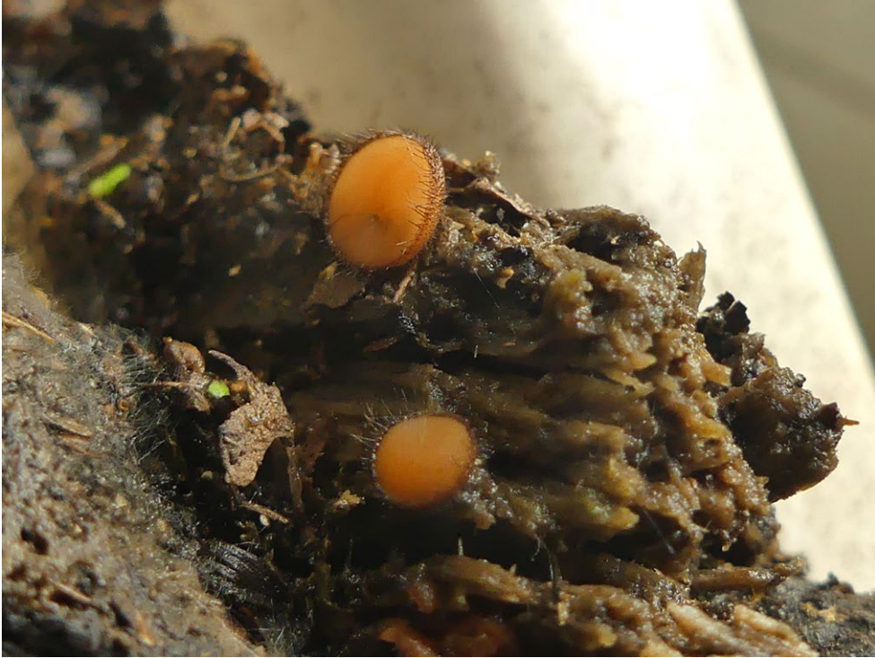
Fot. 3. Owocniki Scutellinia crinita [WA0000167902], 08.08.2024.

Photo 3. Ascogmata of Scutellinia crinita [WA0000167902], 08.08.2024.