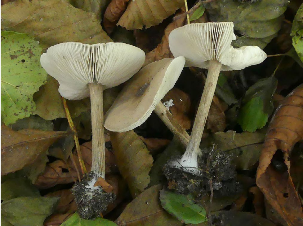
Fot. 22. Owocniki ciemnobiałki białoszarej Melanoleuca polioleuca f. polioleuca [WA0000167850], 25.10.2024.

Photo 22. Basidiomata of Melanoleuca polioleuca f. polioleuca [WA0000167850], 25.10.2024.