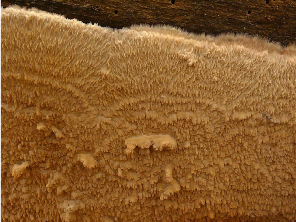
Fot. 14. Owocnik Hermanssonia centrifuga [WA0000167897], 07.11.2024. Photo 14. Basidioma of Hermanssonia centrifuga [WA0000167897], 07.11.2024.

na im. Jerzego Jackowskiego, N2000 Wzgórza Bukowe.