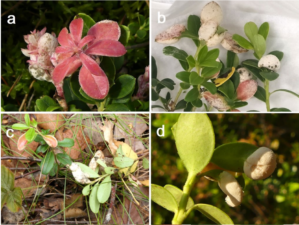
Fot. 9. Płaskosz borówki Exobasidium vaccinii : a) [WA0000167896], 11.08.2024, b) [WA0000168005], 04.07.2024, c) [WA0000168034], 25.08.2024, d) [WA0000167927], 30.08.2024.

Photo 9. Exobasidium vaccinii : a) [WA0000167896], 11.08.2024, b) [WA0000168005], 04.07.2024, c) [WA0000168034], 25.08.2024, d) [WA0000167927], 30.08.2024.