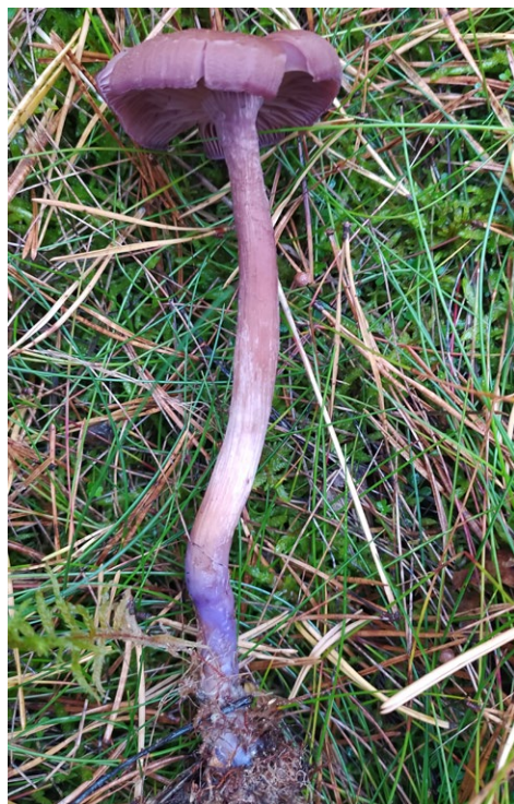
Fot. 18. Owocnik lakówki dwubarwnej Laccaria bicolor [WA0000168128], 13.10.2024.