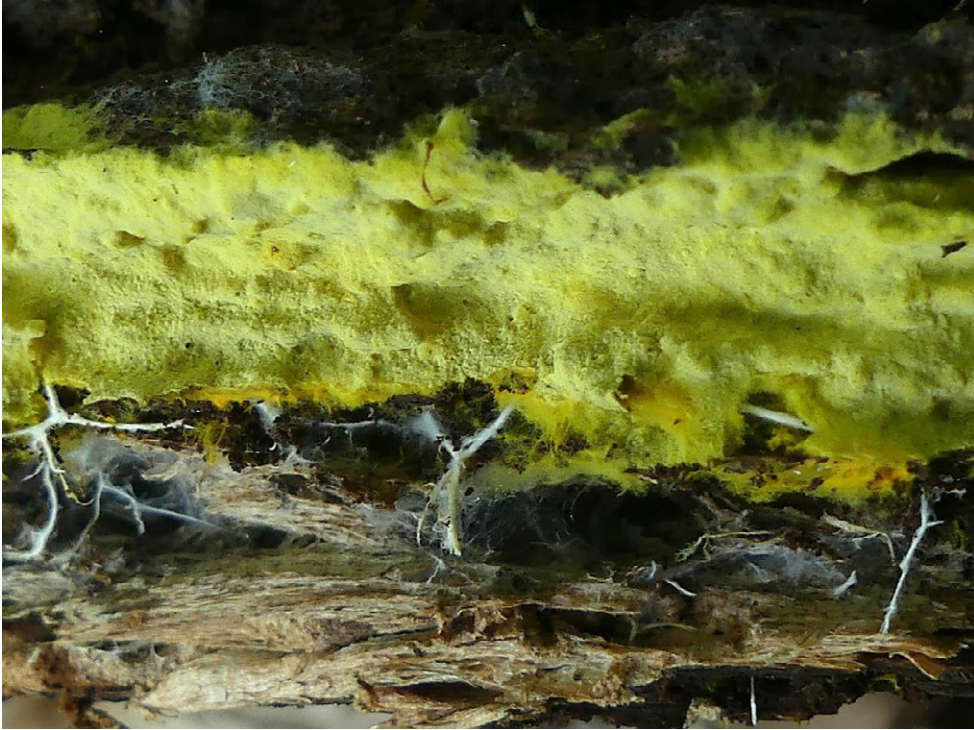
Fot. 27. Owocniki Piloderma bicolor [WA0000167860], 13.08.2024. Photo 27. Basidiomata of Piloderma bicolor [WA0000167860], 13.08.2024.