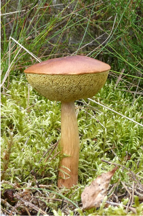
Fot. 5. Owocnik złotoborowika wysmukłego Aureoboletus projectellus [WA0000168039], 25.08.2024.