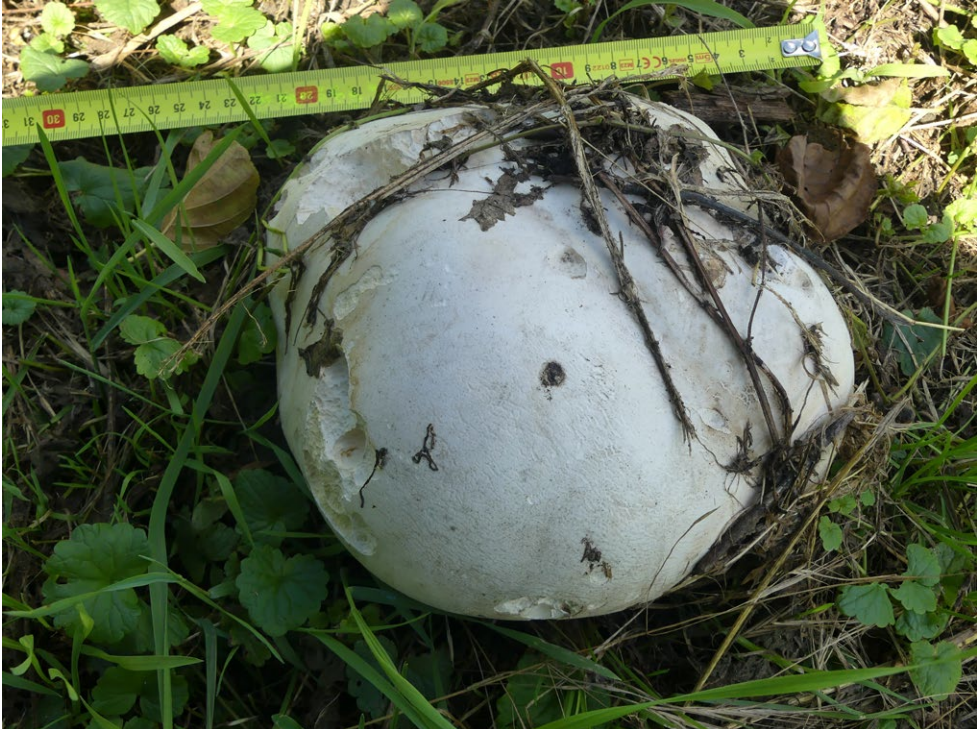
Fot. 20. Owocnik purchawicy olbrzymiej Langermannia gigantea [WA0000167944], 30.07.2024.

Photo 20. Basidioma of Langermannia gigantea [WA0000167944], 30.07.2024 (photo by M. Łożek).