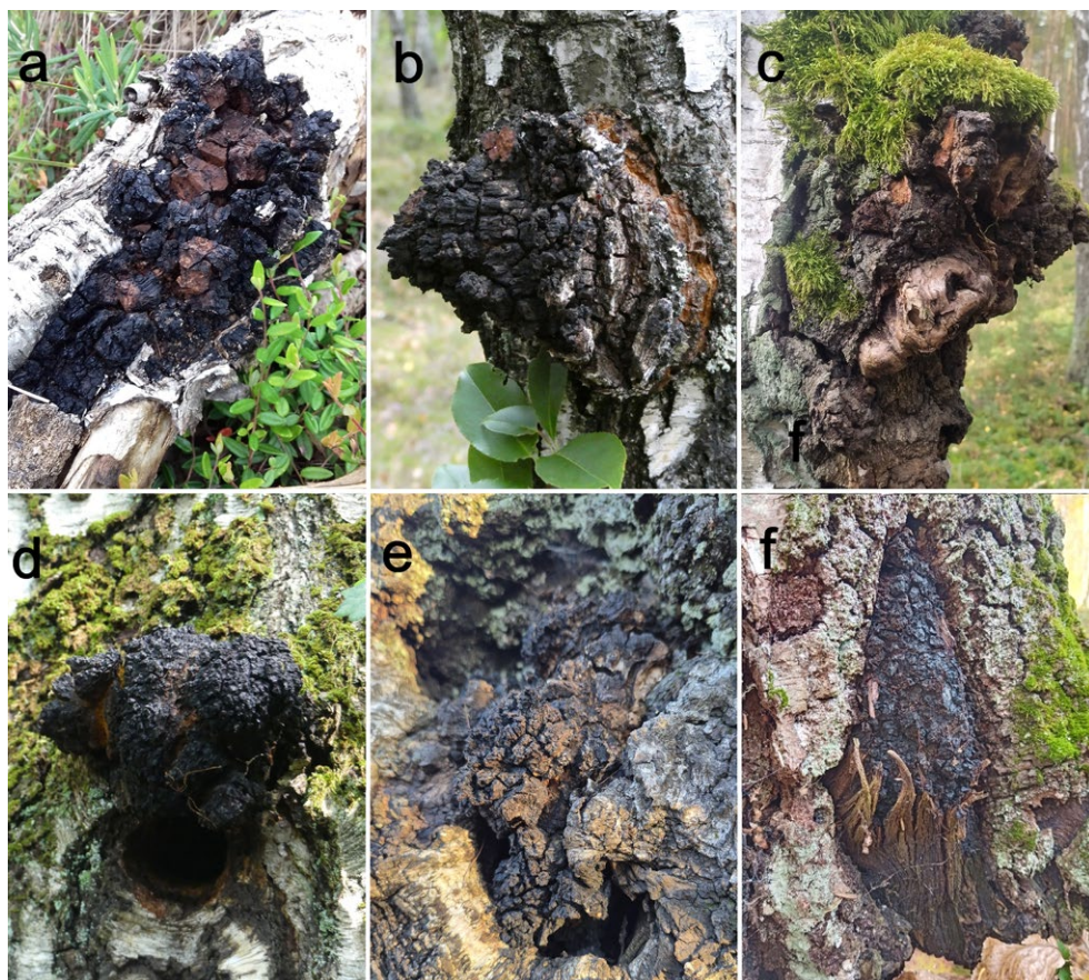
Fot. 16. Skleroty (anamorfy) błyskoporka podkorowego Inonotus obliquus : a) 30.06.2023, b) 25.08.2024, c) 10.10.2024, d) 30.06.2024, e) 19.03.2025, f) 22.10.2024.