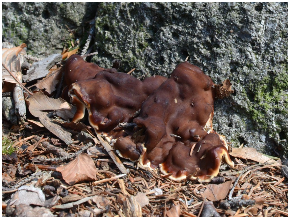
Fot. 2. Owocnik przyczepki falistej Rhizina undulata [WA0000167996], 29.07.2018.