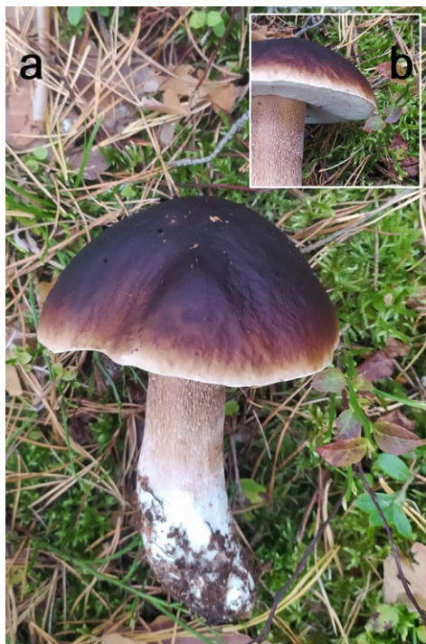
Fot. 6. Borowik sosnowy Boletus pinophilus [WA0000168116]: a) owocnik, b) siateczka na trzonie i hymenofor, 10.10.2024.

Photo 6. Boletus pinophilus [WA0000168116]: a) basidioma, b) mesh on the stem and hymenophore, 10.10.2024.